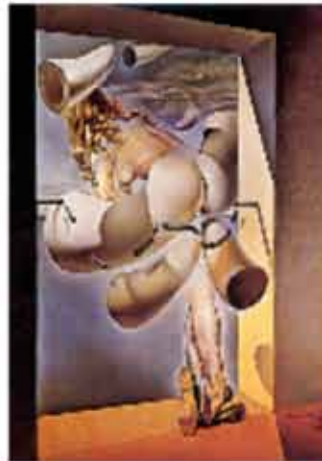
« Jeune vierge auto sodomisée par les cornes de sa propre chasteté » 1954 Les œuvres de l'artiste sont toujours d'une liberté totale, il use sans tabou de sa liberté d'expression sans souci des conventions de l'époque.