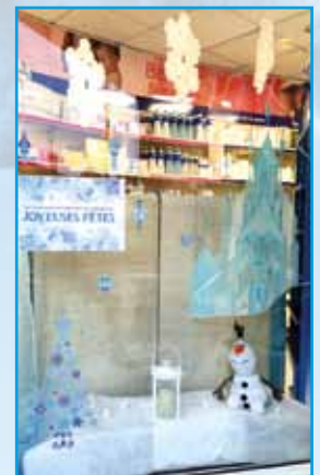
Vitrine Pharmacie Ruspini