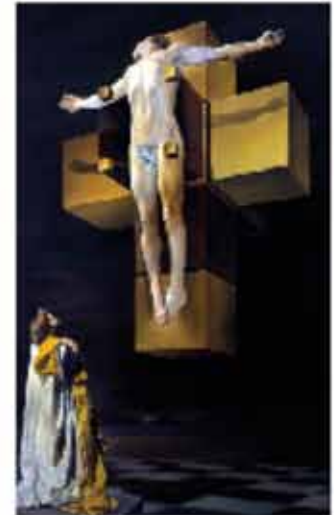
« Crucifixion » huile sur toile 1954 Parmi ses œuvres ultimes citons l'Apocalypse. Quelque 210 kilos, livre- monument conçu fin des années 1950 par J. Foret. «Un livre-cathédrale» Trois ans sont nécessaires pour le construire.

La couverture du livre illustrée par la sculpture de Dalí, une impressionnante porte de bronze incrustée, de 150 kilos, montre le jaillissement apocalyptique. Pour la réaliser, Dalí aurait écaillé à la hache, une plaque de cire dans laquelle il aurait noyé aiguilles, clous, pierres précieuses coquillages, et aussi couteaux et fourchettes en or. Car, selon le maître, «l'Apocalypse, ça se mange fait à point, comme le fromage». Achevée en 1961