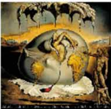
« Enfant géopolitique... » 1943 En mai 1943, Il conçoit un ballet, Café de Chinitas , sur la base d'une histoire réelle adaptée par Federico Garcia Lorca, présentée au Metropolitan Opera New York.