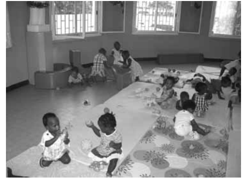
Orphelinat à Dakar