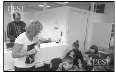
Les enfants de la classe de MS-GS

Cette fois encore, nous avons bien travaillé afin d'améliorer le quotidien des enfants hospitalisés et de leur famille. En effet, nous avons décoré une boîte en carton pour en faire une tirelire. Nous l'avons ensuite nourrie tous les jours de petites ou de grosses pièces.