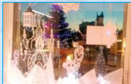
Vitrine Coiffeuse Kihn