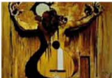
Éléments du décor de « Café de Chinitas »

En 1944, Dalí Press publie le premier roman de Dalí, Visages Cachés . Le 15 décembre, Tristan fou , premier ballet paranoïaque sur le mythe éternel de l'amour dans la mort est présenté pour la première fois à New York. Le décor de Dalí est fondé sur les thèmes musicaux de Tristan et Iseult de Wagner.