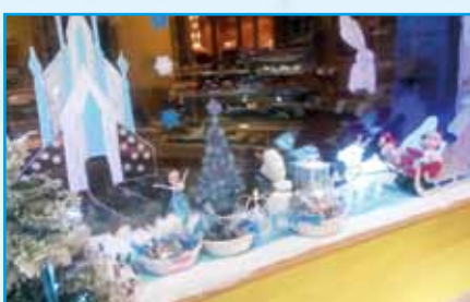
Vitrine Boulangerie Joly