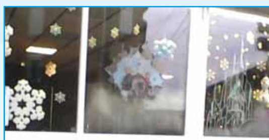
Vitrine Restaurant Puga