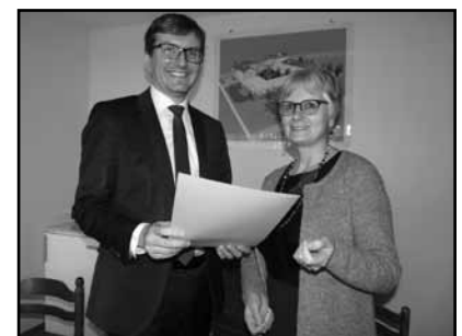
La nouvelle direction

Toutes nos félicitations aux médaillés et longue retraite aux intéressés !