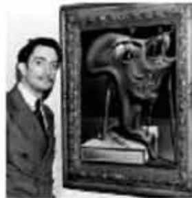
« Sculpture «autoportrait» 27 avril 1967, Salvador DALÍ sur le plateau de "Permis la nuit" : "...lors d'un discours à Polytechnique, je m'adresse à 400 cerveaux de très bonne qualité mais je serais plus heureux de m'adresser à quatre cerveaux de mauvaise qualité mais électroniques"... A propos du sumom donné par André BRETON, "Avida Dollars" « C'est une anagramme qui était magique et qui

m'a apporté une chance extraordinaire car depuis la pluie d'or a commencé à tomber sur ma tête comme une divine diarrhée monotone" puis il continue sur la notion du temps et de l'espace Présence d'Amanda LEAR à ses côtés