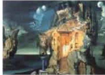
« Tristan fou - 1944 » toile de fond acte 2 - Dalí n'a jamais laissé indifférent ses contemporains. Maître incontesté du surréalisme, fasciné par les sciences, ses dessins sont d'une exceptionnelle précision ; ses peintures aux teintes vives, sa vision empirique des objets qu'il rend vivants laissent dans l'art une trace indélébile.

En 1944, Dalí Press publie le premier roman de Dalí, Visages Cachés . Le 15 décembre, Tristan fou , premier ballet paranoïaque sur le mythe éternel de l'amour dans la mort est présenté pour la première fois à New York. Le décor de Dalí est fondé sur les thèmes musicaux de Tristan et Iseult de Wagner.