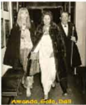
1940 Avec l'incursion des troupes allemandes à Bordeaux, le ménage Dalí s'en va vivre aux États-Unis, où ils resteront jusqu'en 1948.